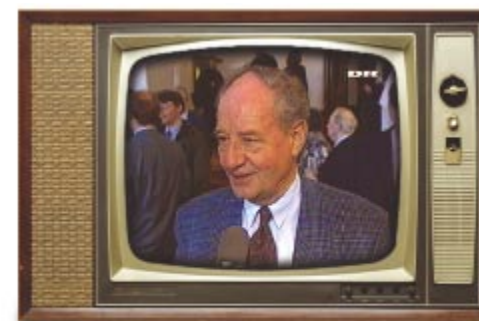
Tidligere formand for Europaudvalget, Ivar Nørgaard (S), i et indslag bragt i TV-avisen i anledning af EU-Oplysningens åbning den 5. april 1994.

Redaktøren brugte sure ord om "en meget bestemt og i bund og grund overflødig affære". Overflødig? Nej! Helt uundværlig for en dansk