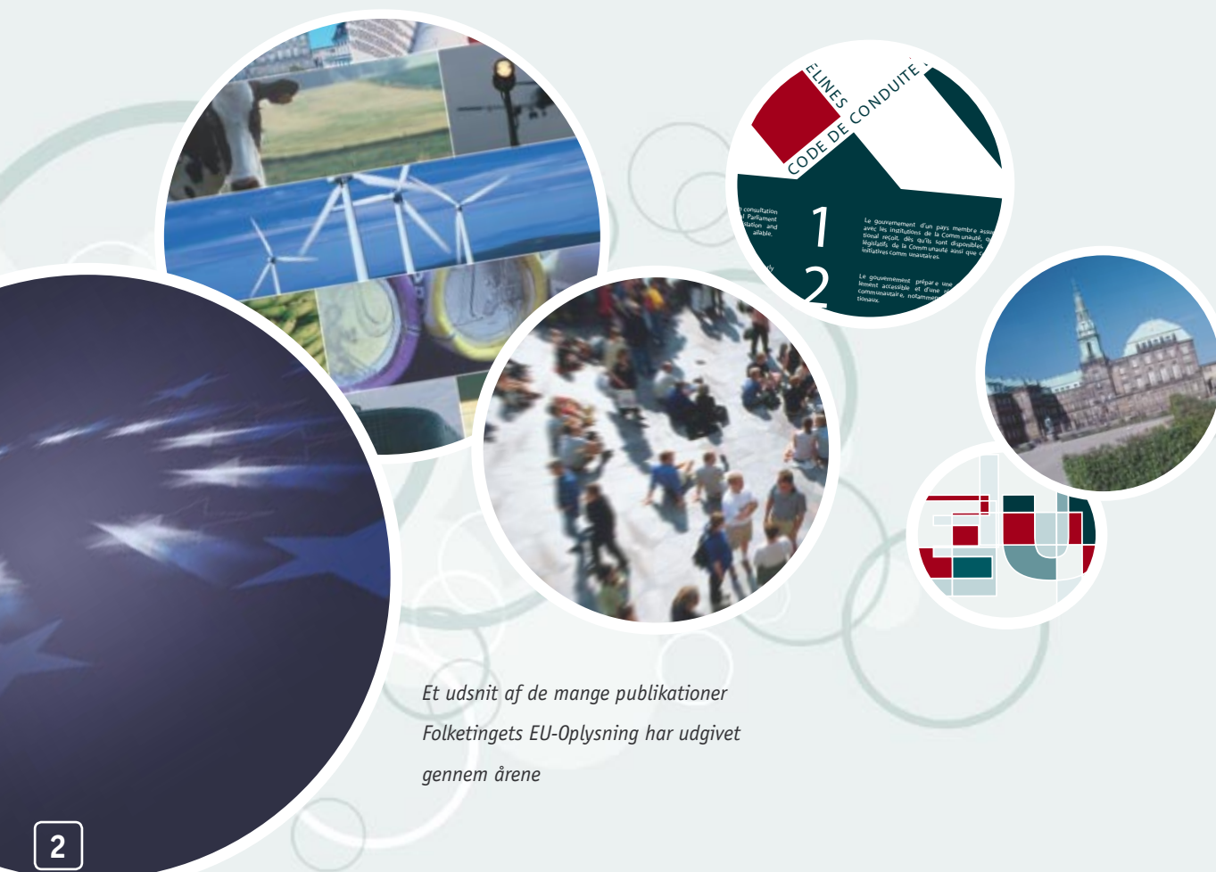
Et udsnit af de mange publikationer Folketingets EU-Oplysning har udgivet gennem årene

Idéen blev – efter mødet i Vejlen og efter afstemningen om Maastricht-traktaten – videreudviklet, dels ved et frokostbord på