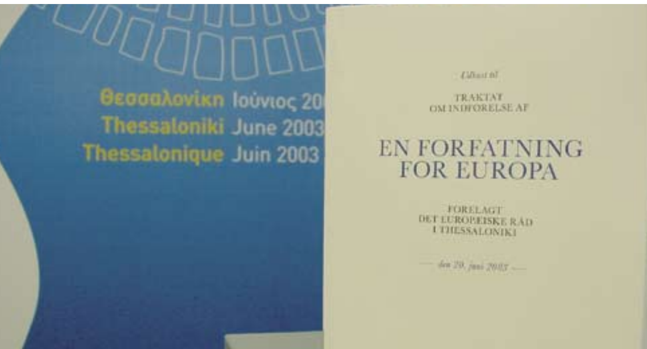
EU-konventets forslag til en forfatning for Europa.

stiller landene med deres miljøministre. Det skal dog tilføjes, at Det Europæiske Råd har mulighed for at oprette specialiserede råd (i stil med den nuværende situation).