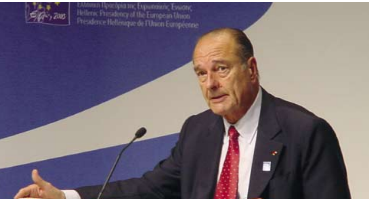
Frankrigs præsident, Jacques Chirac, taler til pressen efter topmødet i Thessaloniki i juni 2003.