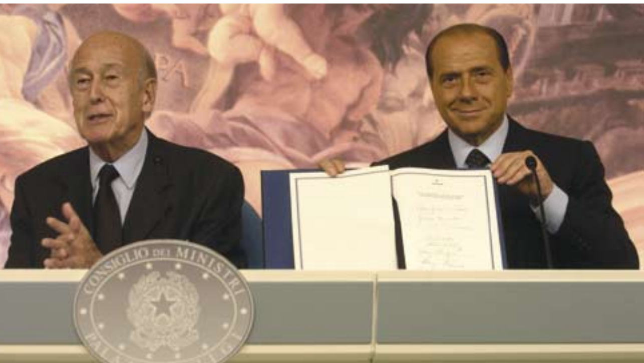
Valéry Giscard d'Estaing (tv.) og Silvio Berlusconi viser EU-konventets forslag til forfatning den 18. juli 2003 i Rom.

(FUSP), mens søjle 3 omhandler politi- og retssamarbejdet. Den største forskel mellem søjlerne er, at samarbejdet i søjle 1 er overstatsligt . Her har EU's medlemslande afgivet suveræniteten til EU, hvilket giver EU mulighed for at vedtage regler, som borgerne i EU skal rette sig efter, uanset hvilken medlemsstat de bor i.