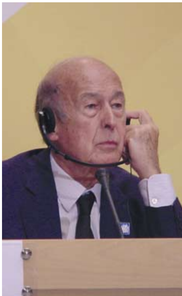
Formand for det europæiske konvent, Valéry Giscard d'Estaing, tidligere fransk præsident.

som ikke har en europakommissær. Det betyder, at Danmark ikke kan regne med at have en kommissær med stemmeret hele tiden. De 13 europakommissærposter går på skift mellem alle lande uanset størrelse.