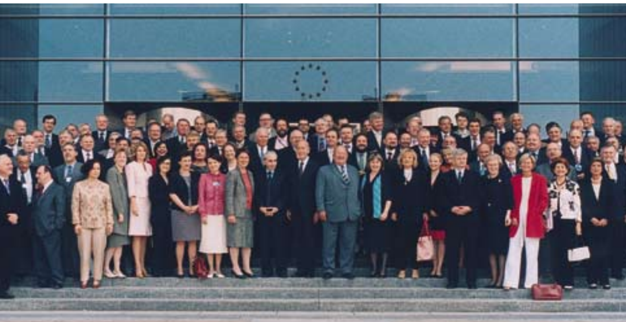
Grøppebillede af EU-konventets medlemmer på dagen for det sidste møde, den 10. juli 2003.