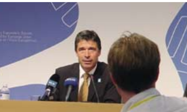
Statsminister Anders Fogh Rasmussen holder pressemøde for danske journalister efter topmødet i Thessaloniki i juni 2003.