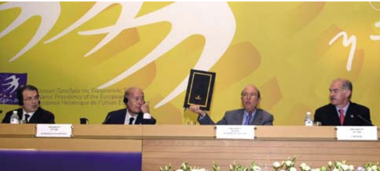
Overrækkelse af EU-konventets forslag til forfatningstraktat. Fra venstre ses kommissionsformand Romano Prodi, konventsformand Valéry Giscard d'Estaing, Grækenlands ministerpræsident, Constantine Simitis, og Grækenlands udenrigsminister, George A. Papandreou.

Medlemslandene stiller med den relevante minister i forhold til, hvad der er på Ministerrådets dagsorden. Er det f.eks. miljø,