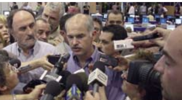
Grækenlands udenrigsminister, George A. Papandreou, taler til journalister ved topmødet i Thessaloniki juni 2003.